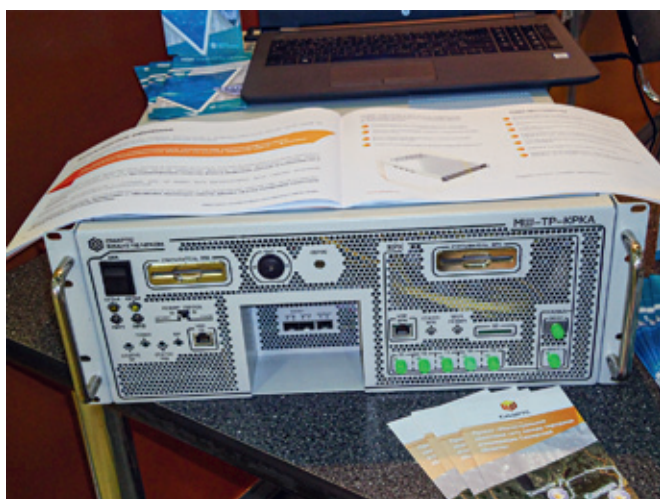
Устройство рассылки квантовых криптографических ключей – разработка ООО "СМАРТС-Кванттелеком" и Университета ИТМО