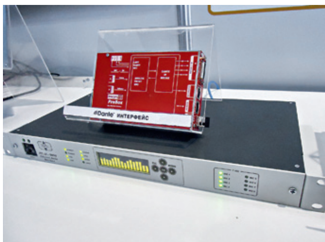
Оборудование компании "ПРОФИТТ" для трансляции аудиосигналов по протоколу Dante

На мероприятии можно было узнать, в частности, о возможностях региональных операторов работать по модели VNO. В этом случае, пока сеть небольшая, оператору нет необходимости организовывать узел спутниковой связи, закупать большой объем ресурса спутников.