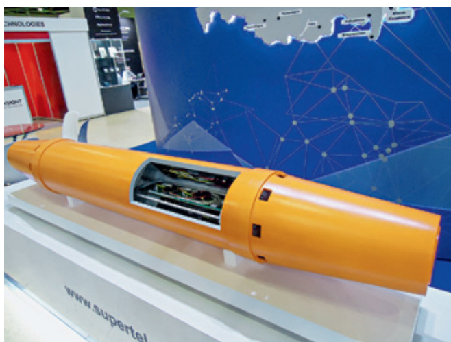
Первый российский усилитель подводной ВОЛС на стенде компании "СУПЕРТЕЛ"

За два года, прошедшие с первого показа на "Связь-2019", система RONET была значительно усовершенствована и получила положительные отзывы специалистов различных отраслей в России и за рубежом. Среди новых функций: несколько вариантов сервера, в том числе с возможностью расширения системы до 10 тыс. абонентов и больше; возможность объединять несколько серверов в одну систему и поставка заказчику сервера в виде