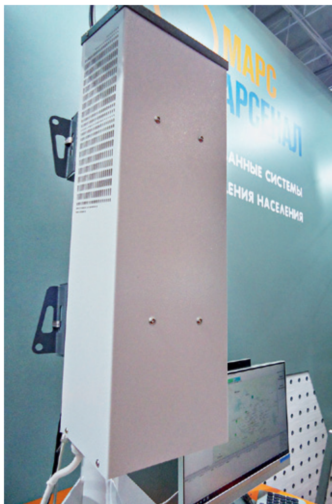
Акустическая система АС-300 Дуо производства "ТРИАЛИНК" отмечена дипломом МЧС России за разработку инновационных систем оповещения

Подведомственное Минцифры России ФГУП "Российские сети вещания и оповещения" (РСВО) на своем стенде представляло программно-аппаратный комплекс УПАК РСВО и систему оповещения на его основе. УПАК РСВО – это отечественная киберфизическая платформа с элементами искусственного интеллекта для управления всесторонней безопасностью объектов и территорий, позволяющая выполнять функции контроля и управления процессами защиты в реальном масштабе времени в обычное время и в кризисных ситуациях. На стенде предприятия также демонстрировалась работа действующего пилотного проекта системы оповещения населения в одном из поселков Республики Хакасия. Данное решение позволяет устанавливать и эксплуатировать системы оповещения в малых и труднодоступных населенных пунктах.